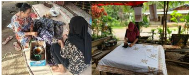
Gambar 3. Kegiatan Pendampingan Batik Cap

Pelaksanaan pendampingan pemasaran diawali dengan tahap persiapan dan penyusunan materi pelatihan digital marketing yang dikostumisasi sesuai kebutuhan spesifik mitra. Mitra juga dikenalkan pada pemanfaatan sosial media sebagai kunci untuk memperluas jangkauan konsumen, yang mencakup pemilihan platform yang relevan seperti Facebook, Instagram dan Shopee, serta teknik penyusunan konten yang sesuai dengan keadaan pasar dan target konsumen. Kelompok perempuan batik diajarkan dalam pembuatan akun sosial media dan e-commerce serta tahapan dalam melakukan pemasaran di platform tersebut agar mempermudah kelompok perempuan batik menggunakan masing-masing platform.