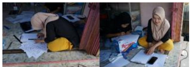
Gambar 2. Proses Pembuatan Motif Batik

Tim Pengabdian Universitas Jambi mendampingi Kelompok Perempuan “Batik Geopark” di Desa Air Batu melalui serangkaian proses pembuatan batik cap yang terstruktur. Proses ini memanfaatkan motif khas yang diambil dari kekayaan budaya dan alam Geopark Merangin, seperti ukiran rumah adat, formasi gerakan tarian tradisional, serta corak fosil flora dan fauna endemik. Dari banyaknya ciri khas dari Desa Air Batu tersebut diambil beberapa motif yang akan dijadikan motif batik khas untuk mengenalkan daerah tersebut dengan hasil kekayaan yang ada pada Desa Air Batu. Hasil cap yang telah dibuat berupa cap batik dengan motif kerang ( brachiophoda ) yang merupakan salah satu fosil yang terdapat di Desa Air Batu yang berumur kurang lebih 290 juta tahun lalu dan motif tari sayak yang merupakan salah satu tari khas daerah Desa Air Batu. Pada cap tumpal yang dibuat terdiri dari ukiran pintu Ngdeh yang merupakan salah satu ukiran peninggalan dari Desa Air Batu dan ukiran masjid peninggalan masyarakat Desa Air Batu yang berumur lebih dari 100 tahun.