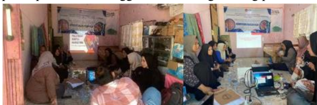
Gambar 4. Kegiatan Pendampingan Pemasaran Digital Marketing

Pelaksanaan pendampingan pemasaran diawali dengan tahap persiapan dan penyusunan materi pelatihan digital marketing yang dikostumisasi sesuai kebutuhan spesifik mitra. Mitra juga dikenalkan pada pemanfaatan sosial media sebagai kunci untuk memperluas jangkauan konsumen, yang mencakup pemilihan platform yang relevan seperti Facebook, Instagram dan Shopee, serta teknik penyusunan konten yang sesuai dengan keadaan pasar dan target konsumen. Kelompok perempuan batik diajarkan dalam pembuatan akun sosial media dan e-commerce serta tahapan dalam melakukan pemasaran di platform tersebut agar mempermudah kelompok perempuan batik menggunakan masing-masing platform.