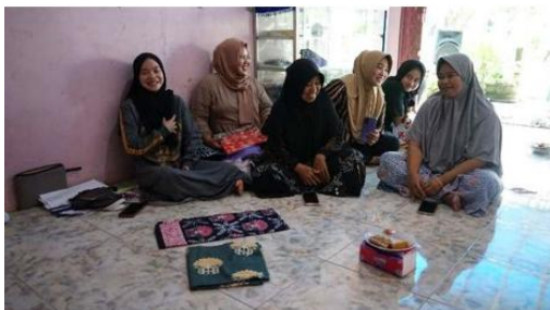
Gambar 1. Kegiatan Observasi Kunjungan Mitra

Tim Pengabdian Universitas Jambi melaksanakan kegiatan pendampingan proses pembuatan batik cap kepada Kelompok Perempuan “Batik Geopark” di Desa Air Batu. Kegiatan ini berfokus pada penerapan motif-motif khas yang terinspirasi langsung dari kekayaan alam dan budaya Geopark Merangin, seperti ornamen rumah adat, pola gerakan tarian tradisional, serta keanekaragaman flora dan fauna khas kawasan tersebut. Melalui pendampingan ini, diharapkan kemampuan para perajin batik dalam menciptakan dan memproduksi kain batik bernilai jual tinggi dengan identitas lokal yang kuat dapat semakin meningkat.