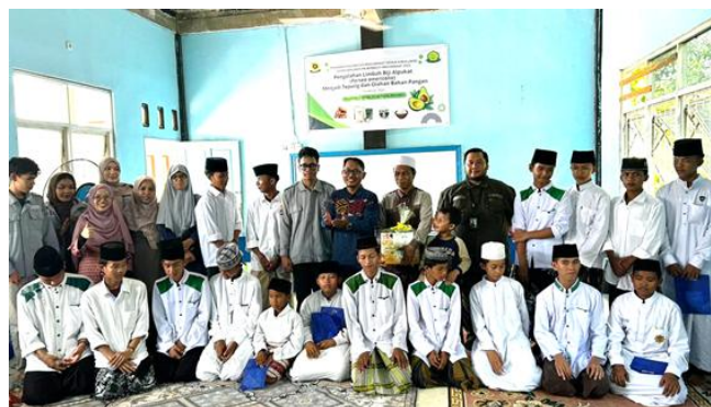
Gambar 6. Dokumentasi kegiatan penyuluhan di Ponpes Nuurul Hikmah, Sungai Pinang