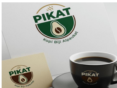
Gambar 5. Desain Produk Olahan PIKAT (Kopi Biji Alpukat)

Hal ini mengindikasikan bahwa proses kondisi pengolahan saat ini (pemasakan/sangrai) telah berhasil menghasilkan profil aromatik yang disukai panelis dan menimbulkan kesan positif menyeluruh. Namun, skor rasa (3,5), warna (3,1) dan tekstur (3,2) relatif lebih rendah. Hal ini menunjukkan adanya aspek teknis yang perlu diperbaiki berupa after-taste (kemungkinan disebabkan kandungan tanin/polifenol ), konsistensi warna seduhan ( over/under-roast atau oksidasi), dan distribusi partikel (kehalusan bubuk) yang memengaruhi mouthfeel . Temuan ini konsisten dengan literatur yang melaporkan bahwa biji alpukat kaya akan polifenol/ tannin sehingga proses pengolahan (panggang, pengeringan, ukuran partikel) sangat menentukan profil sensorik dan fungsi nutrisi tepung/bubuknya. [9]. Adapun desain kemasan produk PIKAT (Kopi Biji Alpukat) tampak pada gambar 5 berikut.