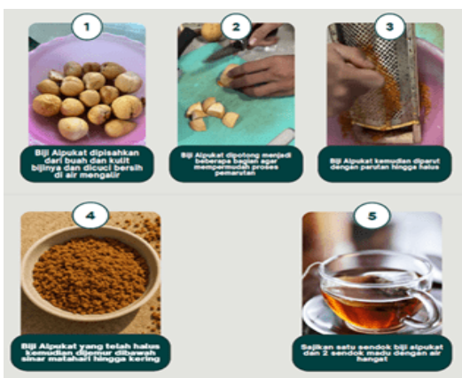
Gambar 3. Skema Pembuatan Terpikat (Teh Herbal Biji Alpukat)

Adapun proses dan tahapan proses pembuatan teh biji alpukat ditampilkan pada skema proses yang tertera pada gambar 3.