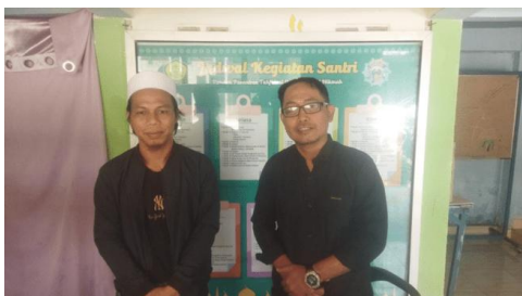
Gambar 1. Dokumentasi Survey dan Perizinan ke Pimpinan Ponpes Nuurul Hikmah

Sosialisasi dilakukan kepada mitra (Ponpes Nuurul Hikmah) untuk memperkenalkan tujuan, manfaat, dan proses kegiatan pengolahan biji alpukat (Gambar 1). Kegiatan ini untuk proses diskusi, tukar pendapat selagi membahas perizinan dan teknis penyuluhan yang akan dilakukan.