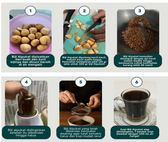
Gambar 2. Skema Pembuatan Pikat (Kopi Biji Alpukat)

Setelah dilakukan kelima tahapan tersebut maka biji alpukat yang diproses selanjutnya dapat diolah lebih lanjut menjadi teh dan kopi biji alpukat maupun tepung dan olahan pangan lainnya. Tahapan uji coba pembuatan kopi biji alpukat yang dilakukan oleh tim pelaksana dapat dilihat pada skema pada gambar 2 berikut