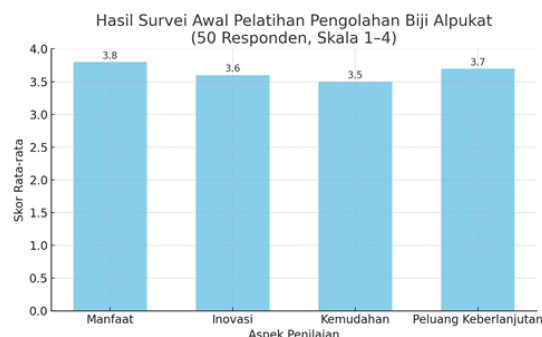
Gambar 6. Desain Produk Olahan PIKAT (Kopi Biji Alpukat)

menunjukkan nilai tinggi (3,7), mengindikasikan adanya potensi untuk melanjutkan kegiatan ini secara mandiri melalui wirausaha kecil berbasis rumah tangga