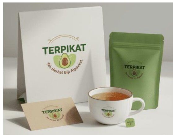
Gambar 7. Desain Produk Olahan TERPIKAT (The Herbal Biji Alpukat)

Selain itu, tekstur seduhan yang terasa kasar diperkirakan berhubungan dengan ukuran partikel bubuk (kehalusan) dan distribusi partikel; literatur terkait flour/powder menegaskan bahwa ukuran partikel memengaruhi mouthfeel , warna seduhan, dan penerimaan sensorik. [16] Pengamatan praktis ini juga konsisten dengan studi-studi yang telah menguji produk minuman/teabag dari biji alpukat yang menemukan pola penerimaan serupa dengan aroma cenderung dapat diterima namun perlu pengembangan pada aspek citarasa dan aftertaste . [13]. Gambar 7 berikut menunjukkan desain produk dan kemasan TERPIKAT (Teh Herbal Biji Alpukat)