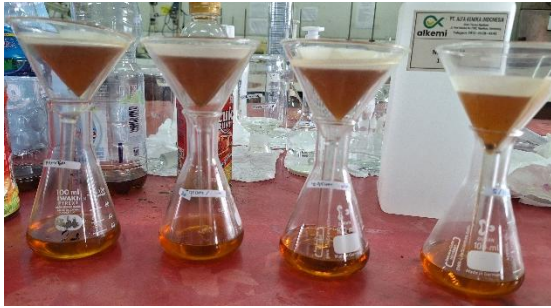
Gambar 1. Proses pemurnian minyak jelantah dengan karbon aktif kulit buah Maja.

Berdasarkan hasil penelitian didapatkan hasil seperti tampak pada Gambar 2.